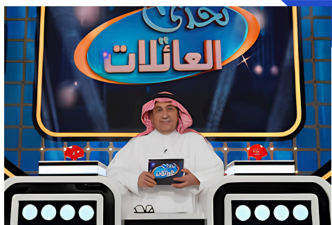
| 2020 تم ادارة محتوى النسخة السعودية من Family Feud-mbc-