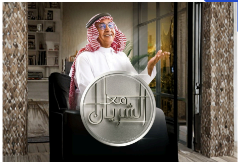
| حلقات تجوب في حياة الشخصيات تم ادارة محتواها على قناة mbc