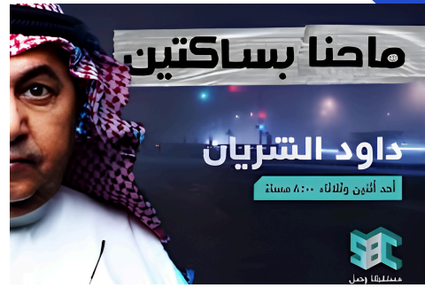
| عام 2019 تم ادارة ونتاج محتوى العديد من الحلقات على SBC