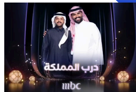
| عام 2026 تم ادارة محتوى تجارب من مخلف مناطق المملكة -MBC