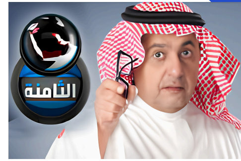
| ما بين عام 2013-2016 تم انتاج حلقات و تقارير عدة لبرنامج الثامنة -MBC